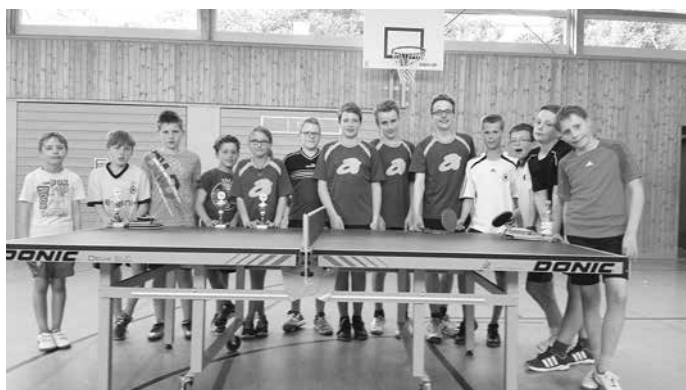
Die Teilnehmer der diesjährigen Jugend-VM

Bei den Jugend-Vereinsmeisterschaften 2015 spielten 13 Kinder und Jugendliche um die Vereinsmeistertitel Jungen U18 und Jugend U12.