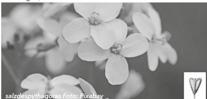
salzdespythagoras Foto: Pixabay

Und als Blume in dieser Woche: Das Hirtentäschel. Der deutsche Name kommt daher, dass die Samenhülse (siehe Bild-im-Bild) der Pflanze einer Stofftasche ähnlich ist, wie Hirten sie trugen. Auch der englische Namen weist darauf hin: Shepherd's purse. Ein unscheinbares (Un-)Kraut am Wegesrand. Zu Unrecht. Bereits Hildegard von Bingen hat seine Heilkraft als Tee-pflanze erkannt. Blüten und junge Triebe werden als Beigabe im Salat geschätzt; die reifen Samen werden wie Pfeffer verwendet oder als Senfersatz zerrieben. Darum auch sein Beinamen „Bauernsenf“.