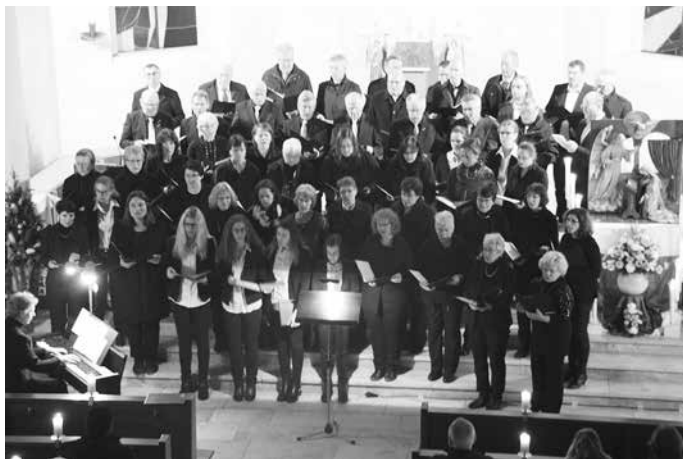
Der gemeinsame Abschluss bei der Feierstunde im Advent in der Pfarrkirche St. Ulrich in Ingerkingen.

Die Spende geht zugunsten der Kindertagesstätte St. Ulrich Ingerkingen. Wir wünschen Ihnen und ihren Angehörigen eine besinnliche Adventszeit und ein frohes, gesegnetes Weihnachtsfest.