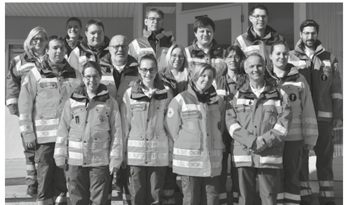
Die Helferinnen und Helfer der DRK-Bereitschaft Schemmerhofen

Die Entlastung des Vorstandes erfolgte einstimmig.