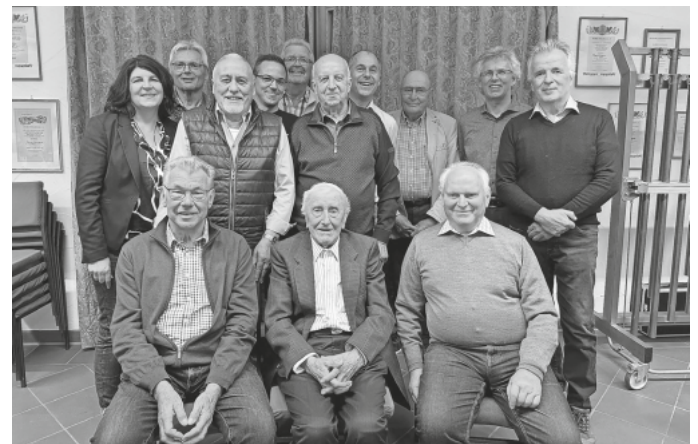
Ehemalige und aktive Funktionäre vom Musikverein Ingerkingen

Ein großes Dankeschön gilt an alle anwesenden Ehemaligen und an das Organisationsteam des Abends!