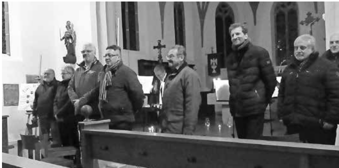
Die Sänger freuen sich am Applaus

Eine ganz besondere Stunde ermöglichte der Männerchor des Gesangvereins Alberweiler am 3. und 4. März seinem Publikum in der Pfarrkirche St. Ulrich in Alberweiler. Der Kirchenraum dunkel, vor und auf dem Altar leuchteten Kerzen. Im Halbkreis formierten sich die 10 Sänger vor dem Chorraum mit Blick zum Altar – und sangen.