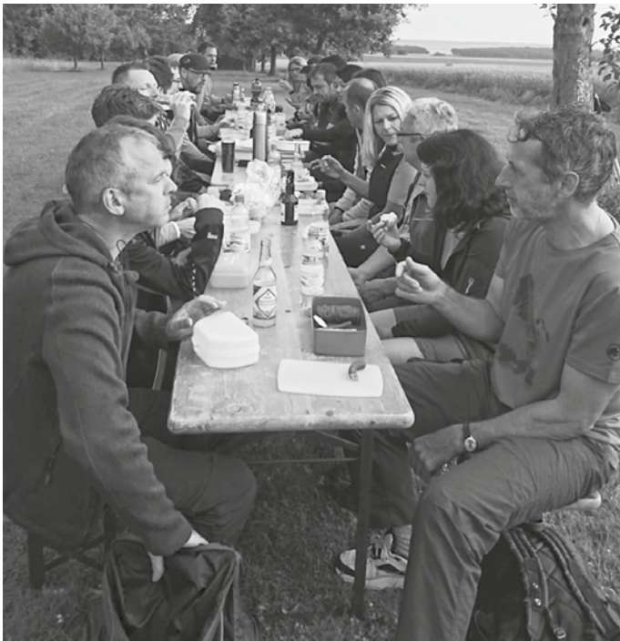
Kurze Stärkungspause vor den letzten Kilometern