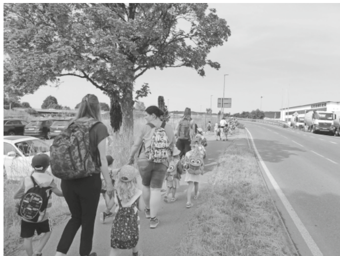
Auf dem Weg ins Museumsdorf Kürnbach.

Wir Kinder waren uns alle einig: Das war ein spannender, lehrreicher und toller Ausflugstag für alle Kindergartenkinder.