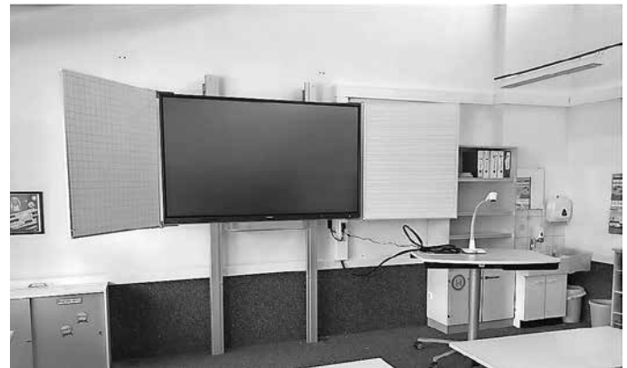
Tafelsystem Grundschule Schemmerhofen