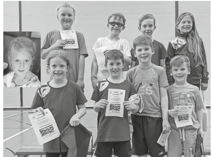
Die Trainingsweltmeister freuen sich über ihre Urkunden.