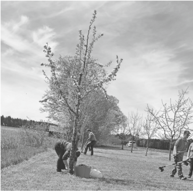
Pflege im Storchenwald

dein Obst- und Gartenbauverein Ingerkingen e.V.