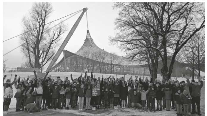
Die SVSler vor der Olympiahalle bei der Handball EM 2024 in München.

Neben den spannenden und knappen Spielen während der jeweils 60 Minuten auf dem Spielfeld, konnten die SVSler gemäß dem EM-Motto „HERE TO PLAY“ bei dem bunten und interaktiven Rahmenprogramm in der Münchner Olympiahalle unter anderem ihre persönlichen Handball-Skills an den Aktionsständen des Bayerischen Handball-Verbandes beim EURO-Slalom und der Multi Ball Wall oder am Wurf-Geschwindigkeits-Modul testen. Nicht zuletzt sorgte in der einstündigen Pause zwischen den beiden Handballbegegnungen das Fan-TV oder die lustigen Fotosessions am Lidl-Photobooth für kurzweilige Unterhaltung. - Ein rundum gelungenes Erlebnis! Ein herzliches Dankeschön hierfür dem Organisationsteam.