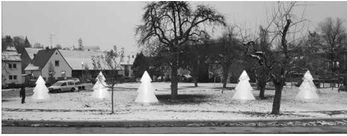
Dorfkultur Schemmerberg e. V.

mit man sie auch bei Dunkelheit sieht, leuchten sie naturgetreu grün. Wir hoffen, wir können so ein wenig Freude schenken und wünschen eine schöne Adventszeit.