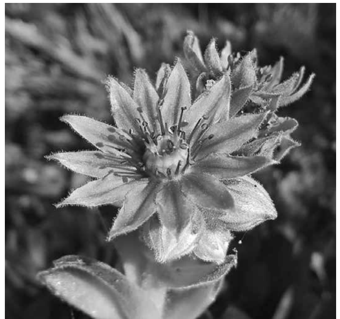
Hauswurz (Sempervivum tectorum)

Wer von seinen Sorgen und seinem Kummer erzählen darf, der macht die Erfahrung: Geteiltes Leid ist halbes Leid; also hinfort nur noch halbe Last. Und mitgeteilte Freude verdoppelt sich beim Erzählen. Durch die Begegnung mit dem anderen, durch das Gespräch mit ihm, wird unser Leben reicher. Und manchem Zuhörer tut es ebenso gut, wenn er hören und spüren darf: Der andere hat auch ein Päckchen zu tragen. Da sind meine Sorgen - im Vergleich mit ihm - eher leichtgewichtig. So profitiert also auch der geduldige Zuhörer vom Gespräch. „Einer trage des andern Last, so werdet ihr das Gesetz Christi erfüllen.“ Der Apostel Paulus erinnert uns daran, dass wir alle in der großen Barmherzigkeit Gottes geborgen sind und darum auch barmherzig Sorge umeinander tragen können.