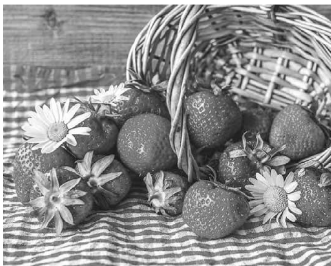
blühende Grüße Dein Obst- und Gartenbauverein Ingerkingen e.V.

Also, schick uns deine Bestellung bis spätestens Mittwoch, 15. Juli 2020 über folgenden Link zu und freue dich im nächsten Jahr auf eine leckere Erdbeerernte: https://sammelbestellung.ogv-ingerkingen.de Oder du meldest dich unter 07356/9504534.