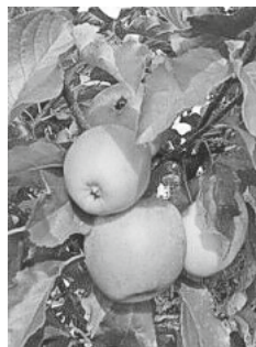
Äpfel Storchenwald

der Frühling ist nicht mehr weit und damit beginnt auch wieder die Pflanz- und Säzeit. Verschaffe dir jetzt schon einen Überblick, welches Obst und Gemüse dieses Jahr in deinem Beet wachsen könnte, mit dem aktuellen Katalog von Samen-Fetzer.