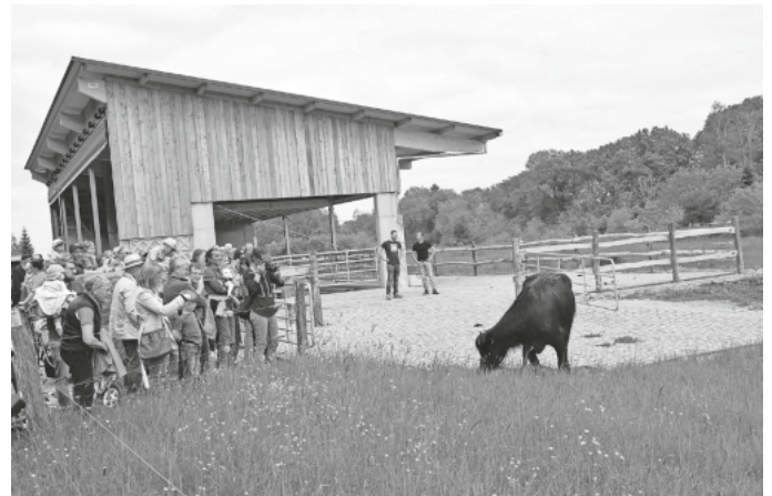
Die Zuschauer verfolgten gespannt, wie die Wasserbüffel zum ersten Mal auf die Wiese gelassen wurden. Das saftige hohe Gras wurde gleich beschnuppert und genüßlich verschlungen.