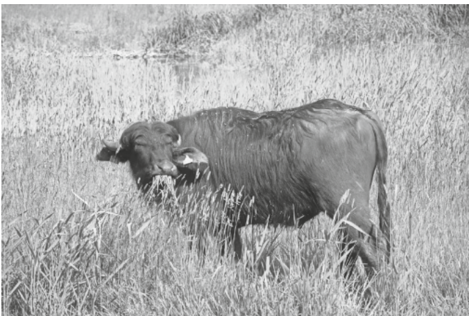
Wasserbüffel Mario (Ohrmarke Nr. 35) nahm die Namensgebung gelassen und genoß einstweilen das saftige Gras auf den Hängleswiesen.