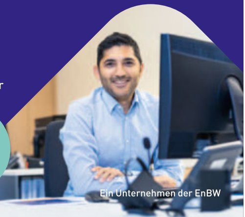
Ein Unternehmen der EnBW