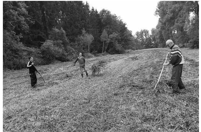
Abräumen des Mähguts im Ried-Biotop

Die Mäharbeiten in beiden Biotopen (Biotop im Pfarrwald, Biotop im Ried) mit einer Gesamtgröße von über 1 Hektar konnten nach vereintem, tatkräftigem Arbeitseinsatz Ende der ersten Septemberwoche abgeschlossen werden. Das Biotop im Ried darf im Jahr nur ein Mal ab September gemäht werden. Bodenbrüter, Kleinlebewesen und Insekten können so über das Jahr ihren natürlichen Lebensraum genießen. Das Mähen der beiden Biotope erfolgt von Hand mit Unterstützung leichter Maschinen. Das Mähgut wird im Anschluss abgeräumt und zu Häufen aufgetürmt. So finden auch Igel und Feldhase über den Winter einen geeigneten Unterschlupf.