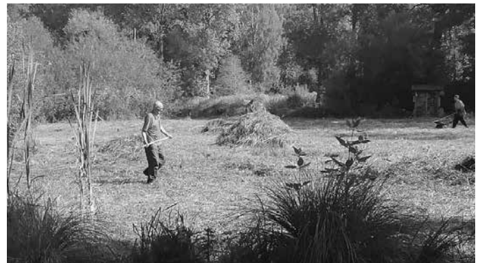
Arbeiten im Biotop Pfarrwald