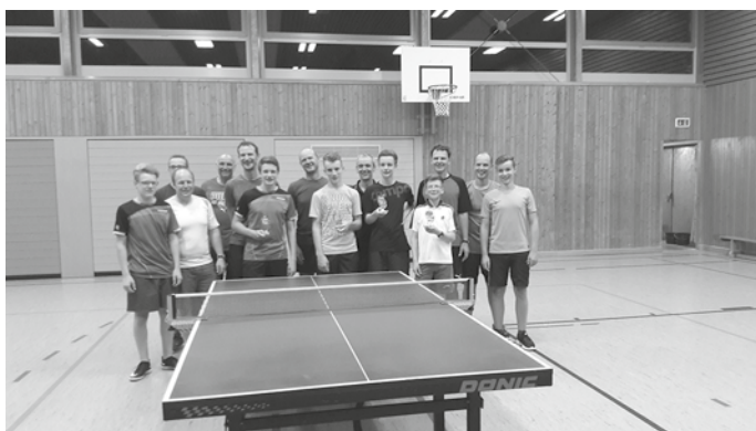
Die Teilnehmer des Eltern-Kind-Turniers 2017