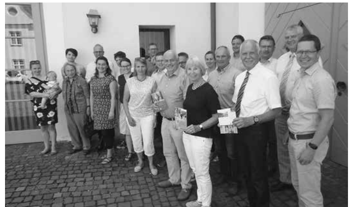
Bürgermeister und Touristiker zeigen sich im Anschluss der JHV dem Fotograf

Feriengemeinschaft „Rund um den Bussen“ legt beachtliches Tempo vor