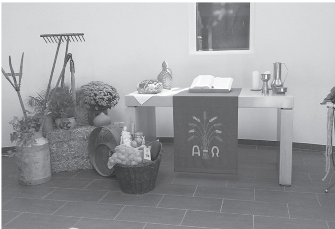
Erntedankaltar in Warthausen

Erntedank heißt: Gott „Danke“ sagen, dass er uns so vieles schenkt. Dass er uns so fröhlich und reich macht. Mit Farben und Tönen, mit Lachen und Singen, mit guten Gedanken und der Gemeinschaft mit anderen. Solche dankbaren Momente und Erinnerungen braucht es. Gerade dann, wenn nicht alles im Leben in Ordnung ist. Wenn es an Gesundheit oder an persönlichem Frieden fehlt; wenn es an Geld oder Perspektive mangelt. Es braucht die dankbare Erinnerung daran, dass Gott es gut mit uns meint. So finden wir den Mut auch die Herausforderungen der Gegenwart anzupacken und zu bestehen. Denn letztlich meint es Gott mit uns gut.