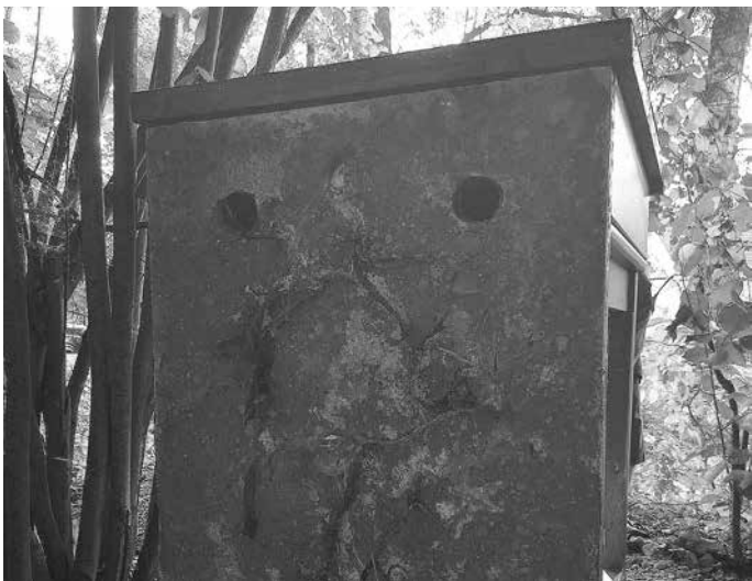
Eisvogelwand mit Brutröhren