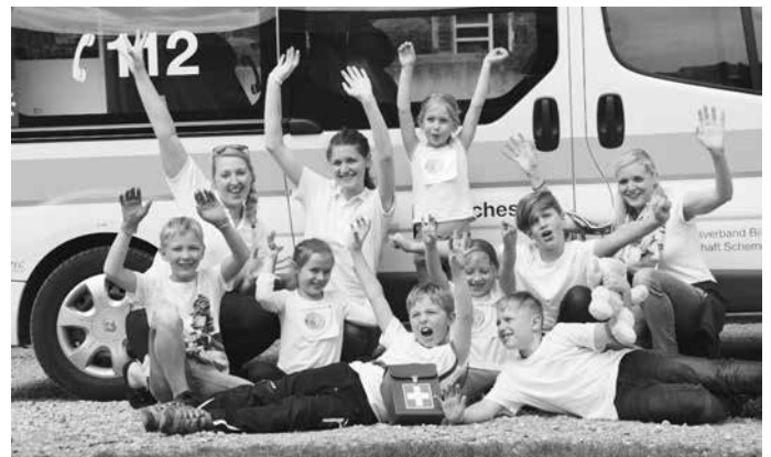
Das Jugendrotkreuz Schemmerhofen jubelt und freut sich über einen grandiosen 2. Platz

Die Gruppen des Jugendrotkreuzes und des Schulsanitätsdienstes in Schemmerhofen freuten sich über Ihre Erfolge beim Kreiswettbewerb des Jugendrotkreuzes des DRK-Kreisverband Biberach am 5. Mai 2018 in der Mühlbachschule. Die Gruppe des Jugendrotkreuzes belegte Platz zwei der Stufe eins. Die strahlenden Kinder freuten sich riesig über ihren Erfolg. Erst im vergangenen Herbst wurde die Gruppe neu gegründet. Großen Dank gilt auch den fünf Gruppenleiterinnen für die Initiative das Jugendrotkreuz in Schemmerhofen zu reaktivieren.