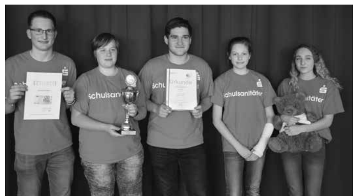
Der SSD 2 freut sich ebenfalls über den 2. Platz in ihrer Altersklasse