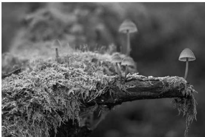
Eine alte Baumwurzel vom Moos überwachsen.

An diesem Sonntag begehen wir den Toten- und Ewigkeitssonntag im Gottesdienst. Wir erinnern uns der Verstorbenen des vergangenen Kirchenjahres und trauern mit den Angehörigen. Dabei spüren wir noch einmal ganz deutlich, wieviel Lücken unter uns entstanden sind: Menschen, die uns lieb und vertraut waren, sind plötzlich nicht mehr da. Insbesondere, wenn wir von jüngeren Menschen Abschied nehmen mussten, wird deutlich, wie nahe wir einander waren und wie groß jetzt der Verlust ist. Beim Abschied von sehr betagten Menschen ist oft das Gefühl von Dankbarkeit da: Wie lange durften wir diesen Menschen bei uns haben, wieviel verdanken wir ihm; wir durften ihn bis ins hohe Alter begleiten und oft auch die letzten Tage oder Stunden ihm nahe sein. Beides, der viel zu frühe, wie der hoch betagte Abschied machen deutlich, wie wertvoll die Zeit miteinander ist. Beide machen deutlich, dass wir das Miteinander im Hier und Heute als kostbare Gelegenheit schätzen sollen für viel Freundlichkeit und Nähe.