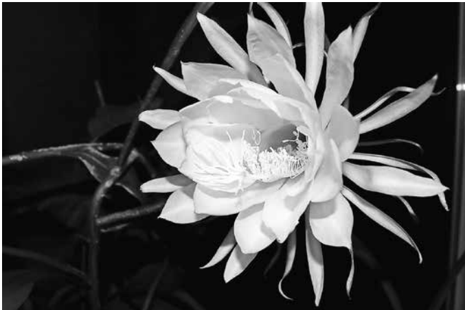
Königin der Nacht

Und mit jedem Glaubensbekenntnis sprechen wir: „Ich glaube ... an die Auferstehung der Toten und das ewige Leben.“