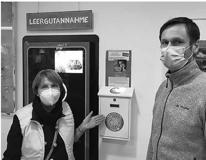
Ihr UNICEF-Team Biberach www.biberach.unicef.de