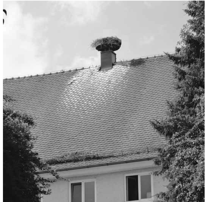
Storchennest Alte Schule Schemmerberg