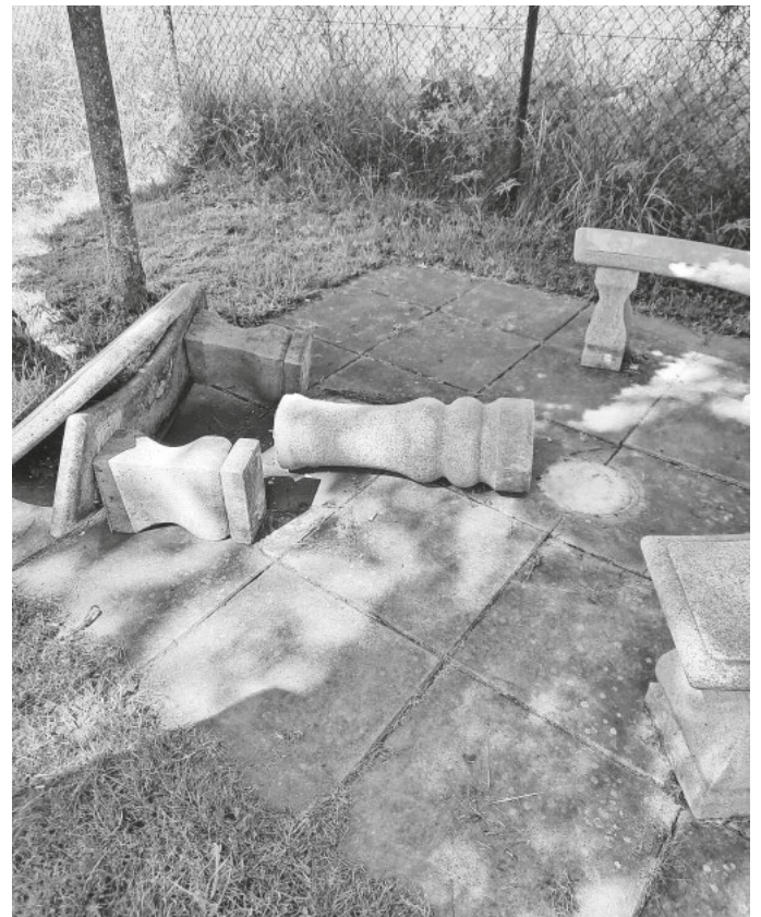
Beschädigter Rastplatz am Jakobsweg