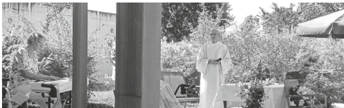
Andacht zu Ehren St. Klara

Besuchen Sie unser sonntägliches Begegnungs Café im Wohnpark St. Klara, IhrFoerderverein-St-Klara@web.de