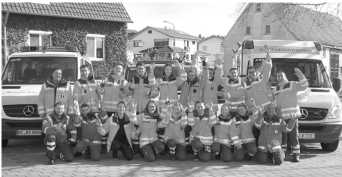
Jubel bei den neuen Sanitätern des DRK: Sie haben die Ausbildung durchlaufen und die Abschlussprüfung bestanden.