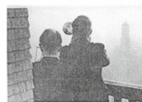
Beim Blasen auf dem Gigelturm ca. 1924