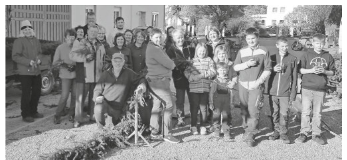
Maibaum-Kranzgruppe, Gesangverein Frohsinn und Obst- und Gartenbauverein Ingerkingen.