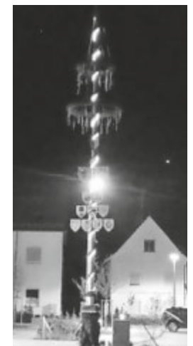
Maibaum 2022 bei Nacht.

Der Kranzgruppe vom Gesangverein Frohsinn und vom Obst- und Gartenbauverein machte es trotzdem viel Spaß und wir sind stolz auf unseren schönen Maibaum am neuen Dorfplatz.