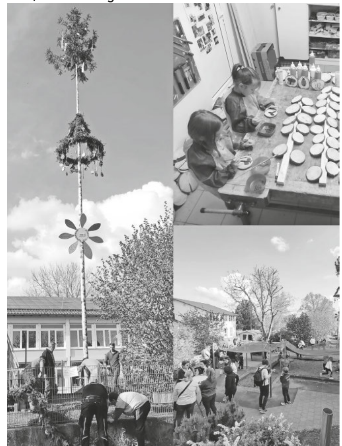
Maibaumstellen am Kinder- und Familienhaus

Viele, viele Hände geben ein tolles Ende!