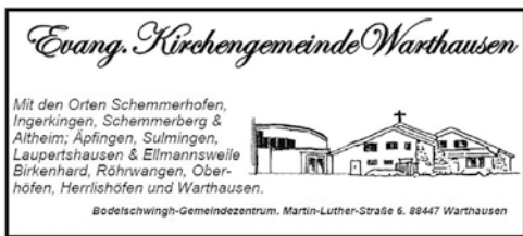
Gemeindebrief zum Weihnachtsfest 2021

Herzlichen Dank allen, die dabei mithelfen.