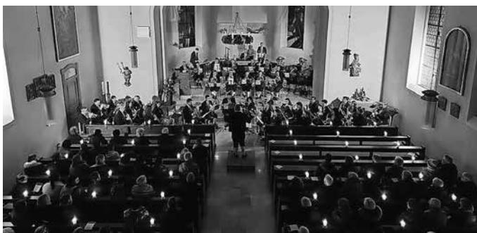
Konzert zur Adventszeit

Am letzten Wochenende fand unser Konzert zur Adventszeit statt. Bei Kerzenschein durften wir die Besucher in der voll besetzten Kirche mit verschiedenen Musikstücken auf den vierten Adventssonntag einstimmen. Zu unserem Programm zählten unter anderem „Highland Cathedral“, „Canterbury Choral“ und „Morricone's Melody“, sowie zwei Weihnachtslieder, die zusammen mit dem Gesang unserer Zuhörer das Konzert abrundeten. Nach der besinnlichen Auszeit von den stressigen Weihnachtsvorbereitungen, durften wir viele unserer Gäste bei dem anschließenden Beisammensein im Gemeindehaus begrüßen. Bei Punsch, Glühwein, Gegrilltem und Waffeln, die von unseren Jungmusikern gebacken wurden, verbrachten wir noch einige gesellige Stunden miteinander.