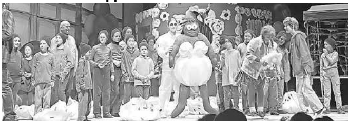
Kinderchor mit Hänsel und Gretel