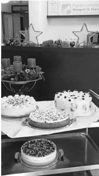
Adventliches Kaffeekränzchen

nun geht schon das dritte durch Corona geprägte Jahr zu Ende. Trotzdem hat der Förderverein versucht, den Bewohnern und Bewohnerinnen des Wohnparks durch wiederkehrende kleine Aufmerksamkeiten Abwechslung und Freude zu bereiten.