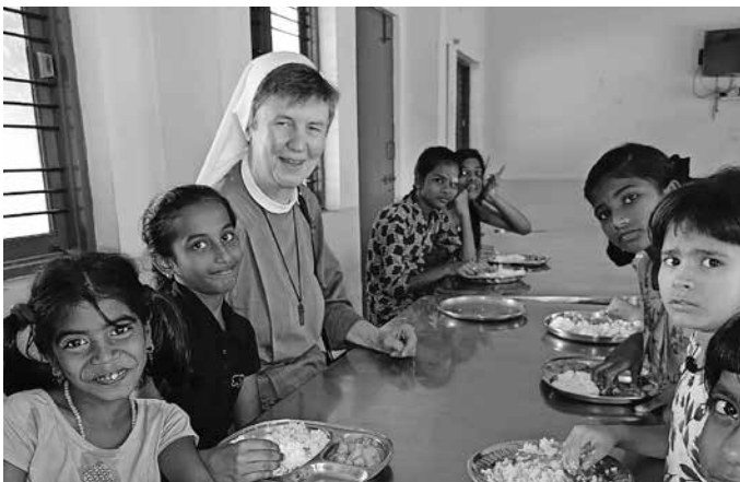
Schwester Viktoria mit den Waisenkindern

Der Missionskreis dankte Sr. Viktoria für die Ausführungen welche zeigten, dass unser Missionspartner Pater Cyril verantwortungsvoll mit den Zuwendungen aus Schemmerberg umgehen würde.