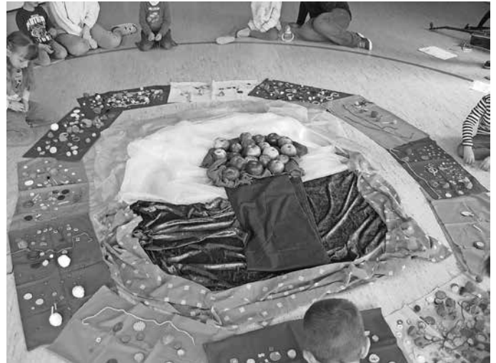
Kathrin Baur

die Kreismitte mit Tüchern, Steinen, Holzstücke, Perlen usw. bestücken und gestalten. Am Ende hatten wir ein kleines Kunstwerk, auf das wir sehr stolz waren.