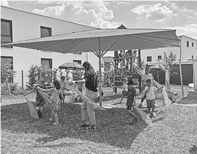
Tüchertanz der VorschülerInnen.