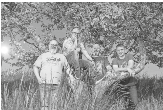
Die Komödianten vom Saubach

Der Sportverein freut sich auf zwei schöne Sommerabende!