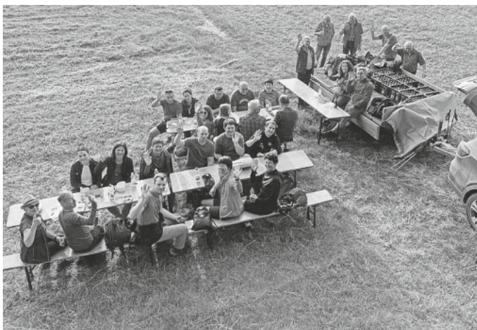
Kurze Stärkung auf dem 24 KM langen Fußmarsch zum Bussen.

Wir haben uns sehr gefreut, dass in diesem Jahr 30 Läuferinnen und Läufer den „heiligen Berg Oberschwabens“ zu Fuß erklommen haben!