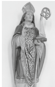
Heiliger Ulrich

Kirchenpatrozinium St. Wendelin am 16. September 2023 – Gottesdienst in Grafenwald