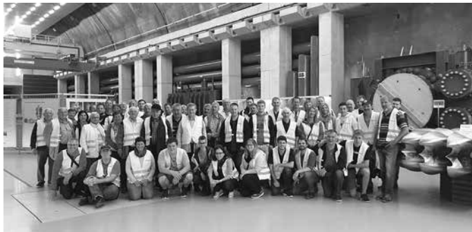
Teilnehmer der Informationsfahrt besichtigten die Illwerke

Die nächste Feuerwehrprobe findet am Montag, 09.09.2019 um 20.00 Uhr statt. Um vollzähliges und pünktliches Erscheinen wird gebeten.