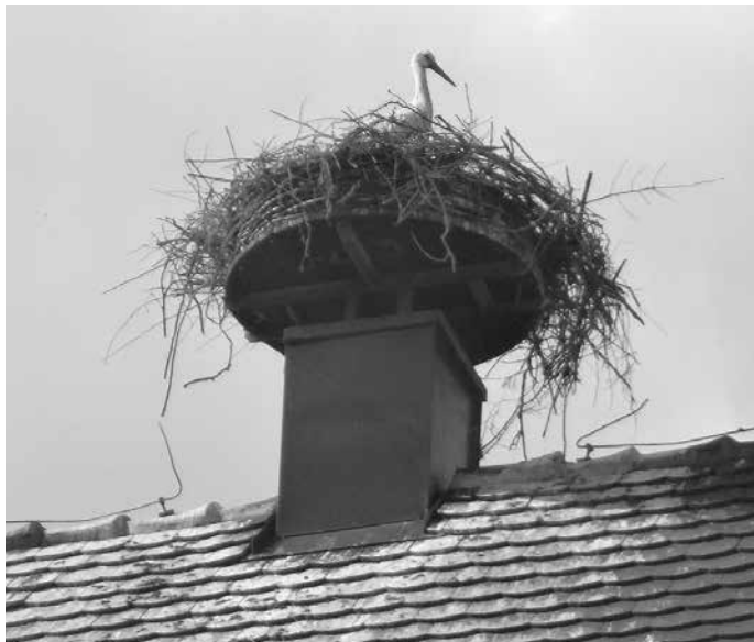
Jungstorch auf der Alten Schule

Die Storchensaison 2019 bringt wieder erfolgreichen Nachwuchs mit sich. Im Storchenbiotop sind zwei Jungstörche im Nest zu entdecken, die sich bereits prächtig entwickelt haben. In der Ortsmitte wurde das Storchennest leider entfernt und so musste das Storchennest auf die Alte Schule ausweichen. Dort befindet sich nunmehr ein gesundes Junges im Storchennest. Das Storchennest 2019 darf man in Schemmerberg mit insgesamt drei Jungstörchen somit durchaus als zufrieden stellend bezeichnen.