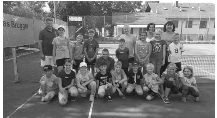
Teilnehmer des Sommerferienprogramms

Am Freitag den 02.08.19 fand auf der Tennisanlage des TCI das Sommerferienprogramm statt. Bei strahlendem Sonnenschein nahmen 17 Kinder teil. Bei Spielen rund um den Tennisball verbrachten alle einen lustigen und abwechslungsreichen Nachmittag. Zur Stärkung gab es noch ein leckeres Eis sowie gekühlte Getränke. Ein schöner Nachmittag mit viel Spaß und guter Laune für alle Teilnehmer.