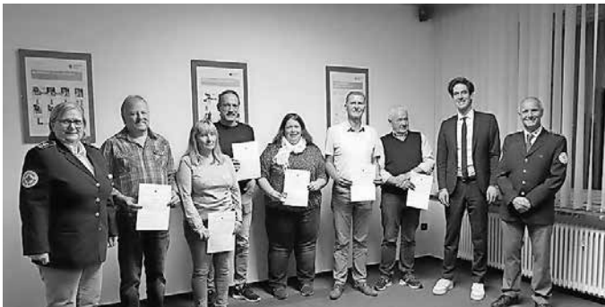
Die Geehrten für 50-maliges Blutspenden