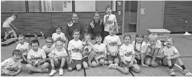
Die Kinder der F-Jugend nach ihrem erfolgreichen Spieltag in Ochsenhausen.

Am 08.10.22 hatte die F-Jugend den ersten Spieltag der Saison in Ochsenhausen. Gestartet wurde mit allen 6 Mannschaften mit dem Aufwärmispiel: Feuer, Wasser, Sturm. Danach zeigten unsere jungen Handballkinder im Bewegungs-Parcour ihr Können. Bei den darauf folgenden 2 Handball- und 2 Königsballspielen konnte sich unsere Mannschaft siegreich behaupten. Nach der Abschlussstaffel endete dieser Spieltag.