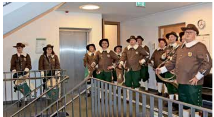
Für die musikalische Umrahmung sorgte der Fanfarenzug Sche-ho...