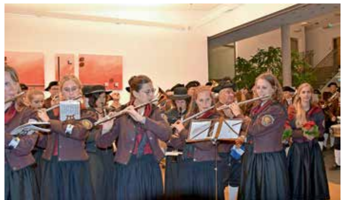
... und der Musikverein Schemmerhofen mit Unterstützung von Musikanten aus Altheim.