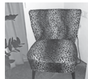
Nicht wegwerfen, sondern neu gestalten!

Fun-Balkan, im Electrostyle, hart am Herzschlag und kompromisslos sexy. Seid Ihr bereit, für einen irren Trip? Anschließend legt Selektor Tom vom „Schüttel Dein Speck“ Team noch Perlen der Balkanmusik auf. Konzert, Samstag, 15.10.22 um 20 Uhr, Einlass 19 Uhr Eintritt 10 Euro, ermäßigt 7 Euro.