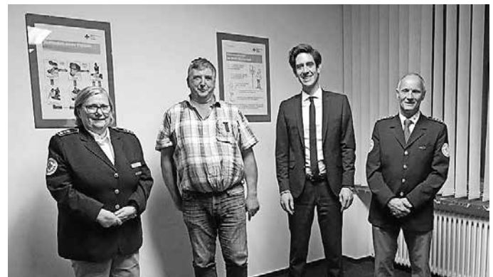
Der Geehrte für 125-maliges Blutspenden: