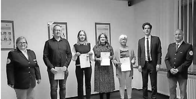
Die Geehrten für 10-maliges Blutspenden