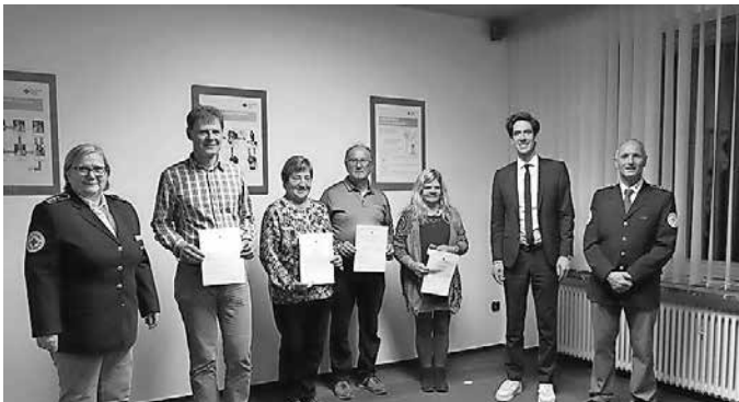
Die Geehrten für 75-maliges Blutspenden